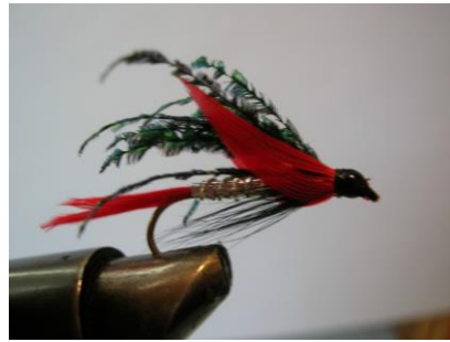
Réaliser la tête de la mouche. Faire le nœud de finition et vernir la tête ...