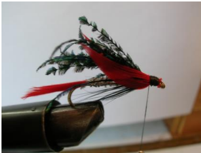
Fixer de chaque cotés une portion de plume rouge pour les ailes latérales ...