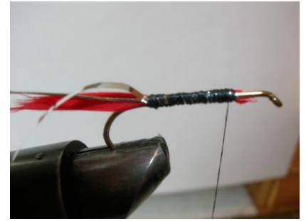
Fixer les tinsels rond et plat à la courbure. Ramener le fil vers l'avant ...