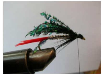
Fixer une pincée de fibres de coq noir pour la bavette ...