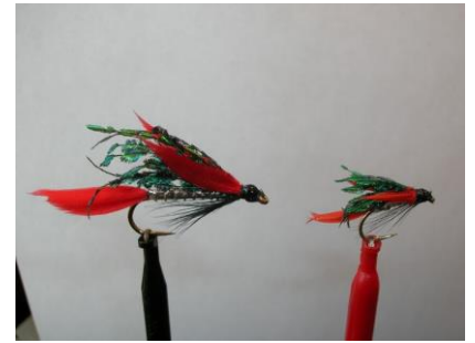
La mouche est terminée. La même en noyée ...