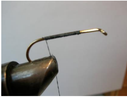
Amener le fil de montage à la courbure ...