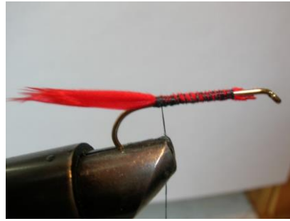
Fixer une portion de plume rouge et former un sous corps ...