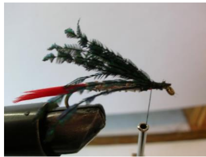
Fixer une dizaine de fibres de sabre de paon pour l'aile dorsale ...