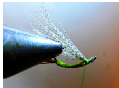
Fixer à l'intérieur de la courbure une aile en canard pointillé ...