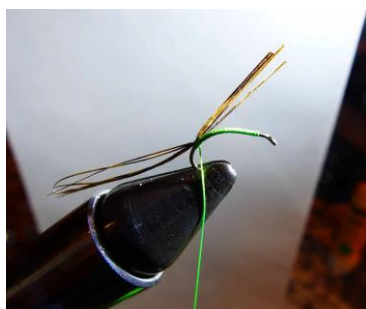
Fixer 4 à 5 fibres de queue de faisan commun ...