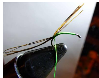
Fixer solidement par 2 ou 3 tours ...