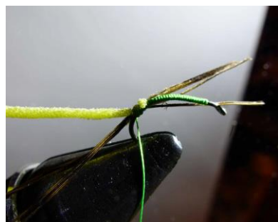
Fixer la micro chenille jaune et laisser la soie verte en attente...