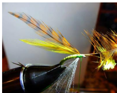
Fixer vos 2 plumes : une rousse et une jaune ...