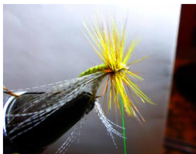
Tourner-les en hackles serrés puis nœud final ...