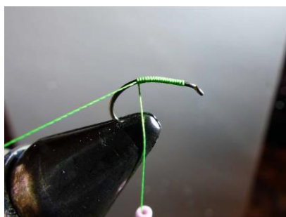
Amener le fil de montage à la courbure ...