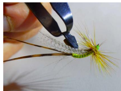
Une petite goutte de colle ou vernis Et La mouche est terminée ...