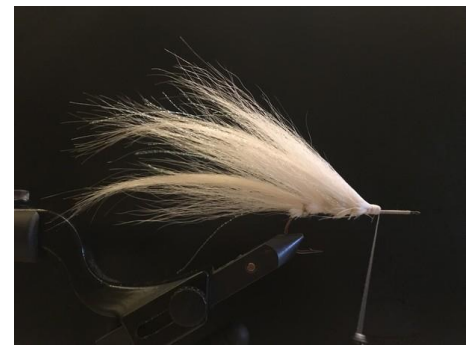
Y incorporer quelques fibres holo.