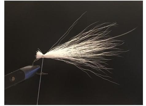
Fixer vers l'avant une touffe de bucktail blanc.