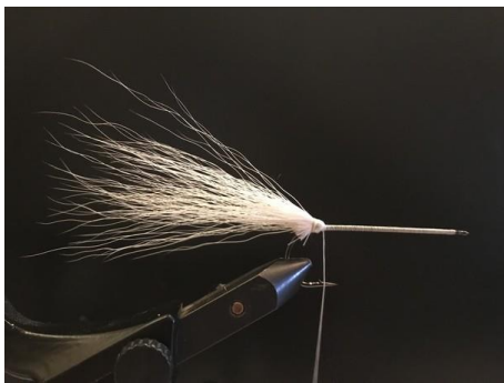
La rabattre vers l'arrière.