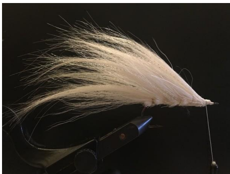
Monter votre mouche par touffes successives.