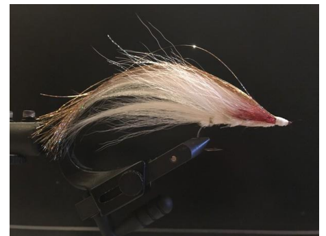
Fixer quelques fibres argent ou or sur le dessus, nœud final et vernis UV.