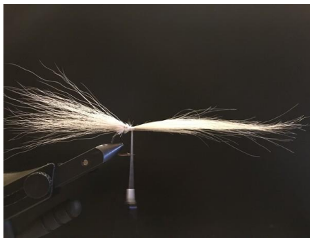
Répéter ainsi cette opération en alternant bucktail / chèvre blanche.