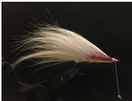
Fixer de chaque côté une petite touffe de flashabou rouge.