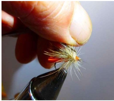
Nœud final et vernis puis ébouriffer votre collerette de lièvre