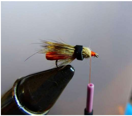
Fixer et tourner votre tête