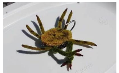
Petit crabe ... fini