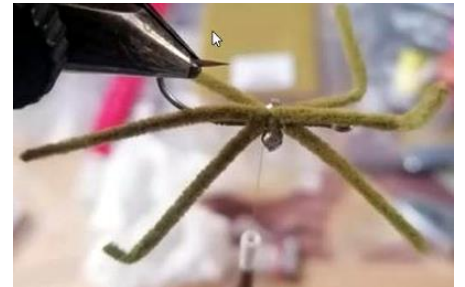
Poser la deuxième puis la troisième