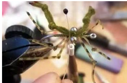
Faire des yeux en fil nylon teinté