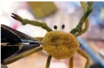
Les 2 yeux doivent légèrement dépasser