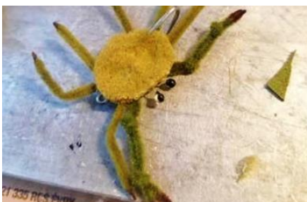
Au marqueur indélébile à cette étape,