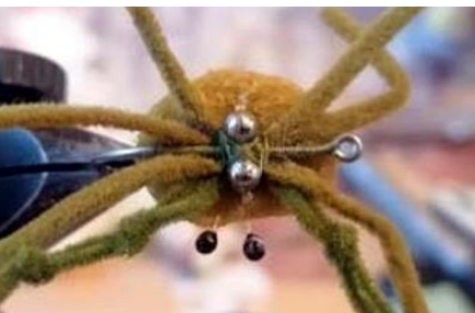
Fixer la carapace à la colle cyano