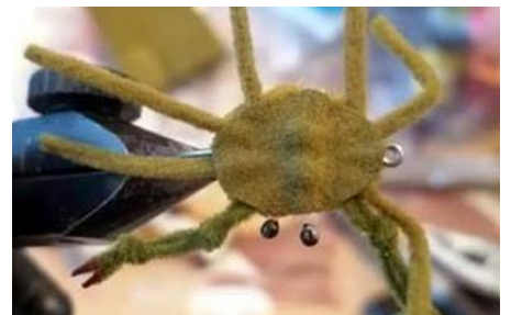
Coller le dessous du crabe