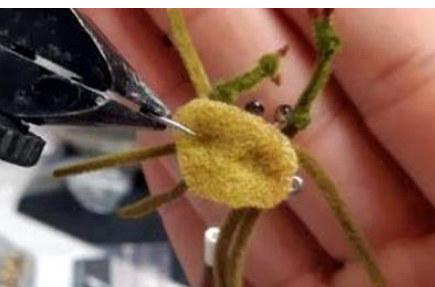
Vous pouvez faire des traces marrons,