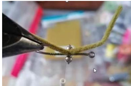
Poser la première paire de pattes