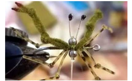
Poser les deux yeux