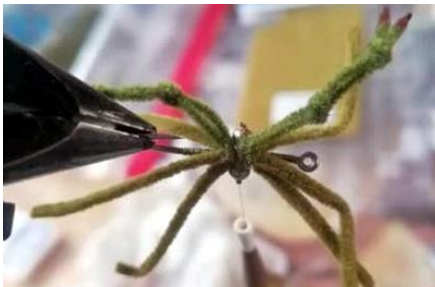
Poser la paire de pince