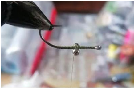
Poser des yeux chainettes