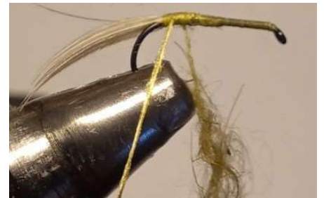
Préparer un dubbing de lièvre sur fil poissé