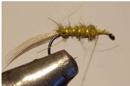
Cercler le corps et bloquer le montage. Réserver un peu de place en tête, pour fixer l'aile et le hackle