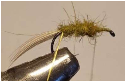
Former le corps renflé en dubbing