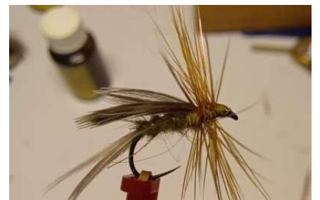
Réaliser votre thorax autour du parachute