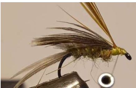
Remonter votre fil sur l'antron puis redescendre