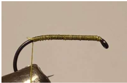
Soie de montage sur toute la hampe