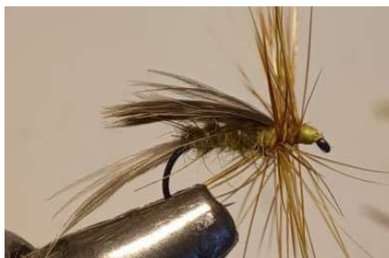
Réaliser une mèche de dubbing écureuil noir