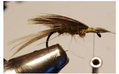
Poser l'aile à plat. Elle dépasse de la courbure de l'hameçon. Bien serrer le montage à ce niveau, pour empêcher l'aile de tourner sur l'axe.