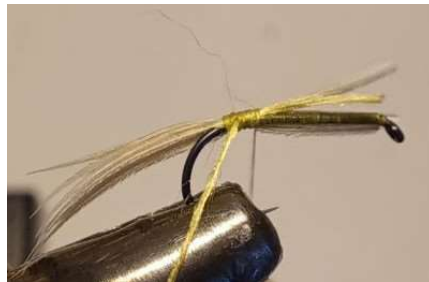
Poser quelques fibres de plumes blanches pour l'exuvie et un fil ou tinsel jaune or pour le cerclage du corps